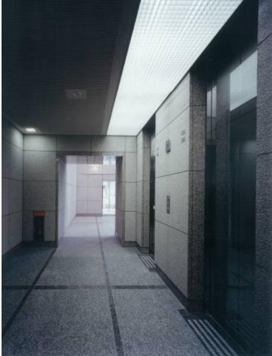
1F エレベーターホール