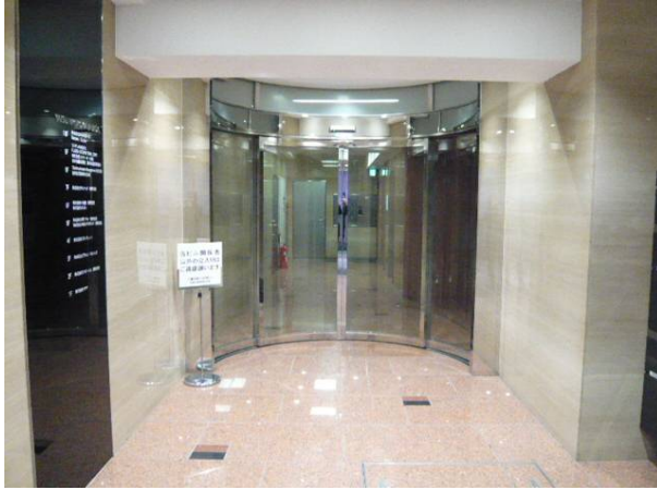
エントランスホール