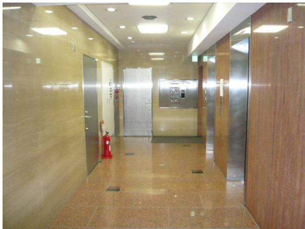
エレベーターホール